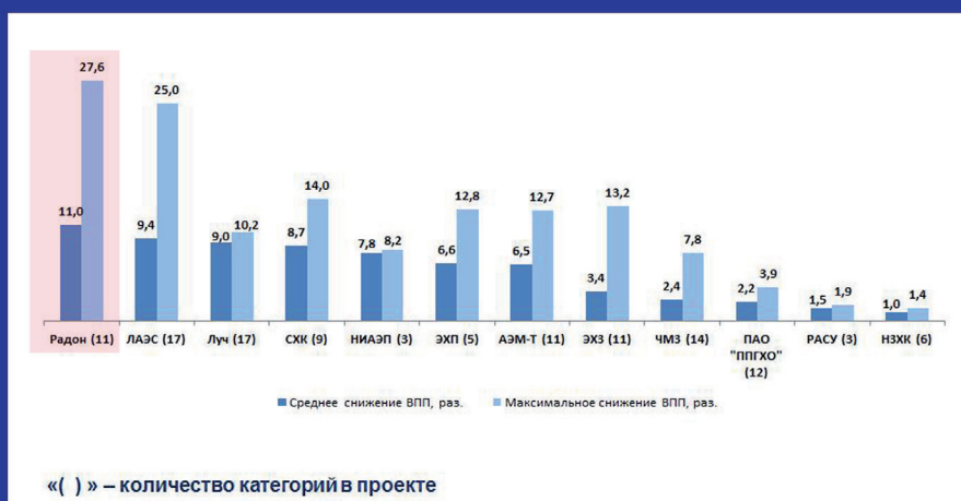
Диаграмма рейтинг организаций в зависимости от сокращения ВПП МТО